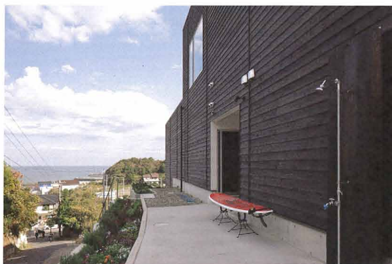
サーフィンから帰って部屋に戻る前に砂や海水を落とせるよう外にもシャワー設置。ボードの置き場所もある。