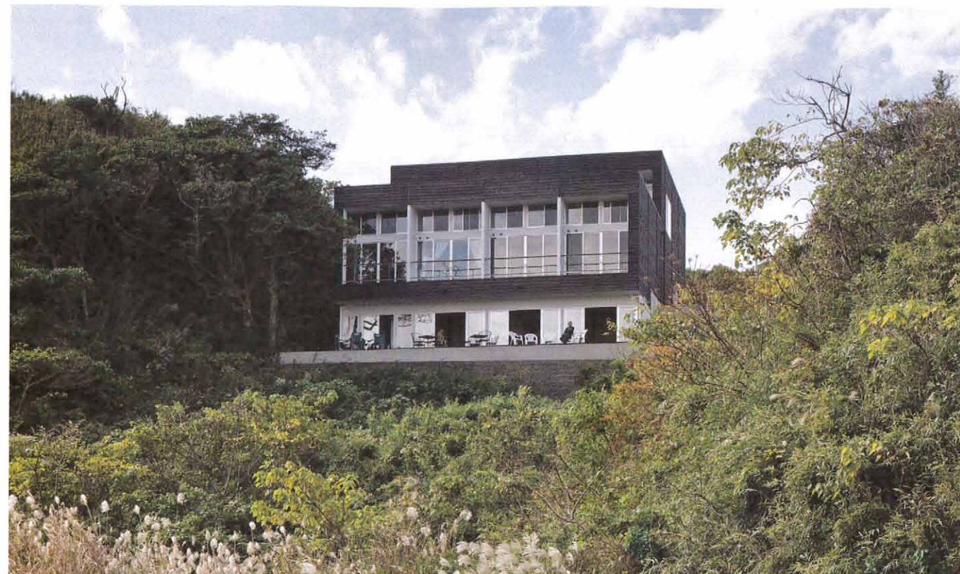
基礎はコンクリートでしっかりと打っているが、建物自体は木造。1階のカフェは住人のみならず一般客も利用可。