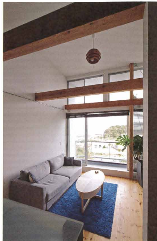
ワンルームタイプの部屋。天井に渡された梁が特徴的。床板を渡せば、新たな部屋を作ることができる。