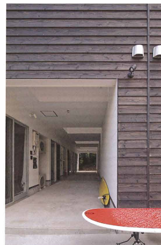
左がワンルームタイプの住居となる。通路の天井は四角く切り取られ、天気の良い日が差し込んで美しい影を作る。