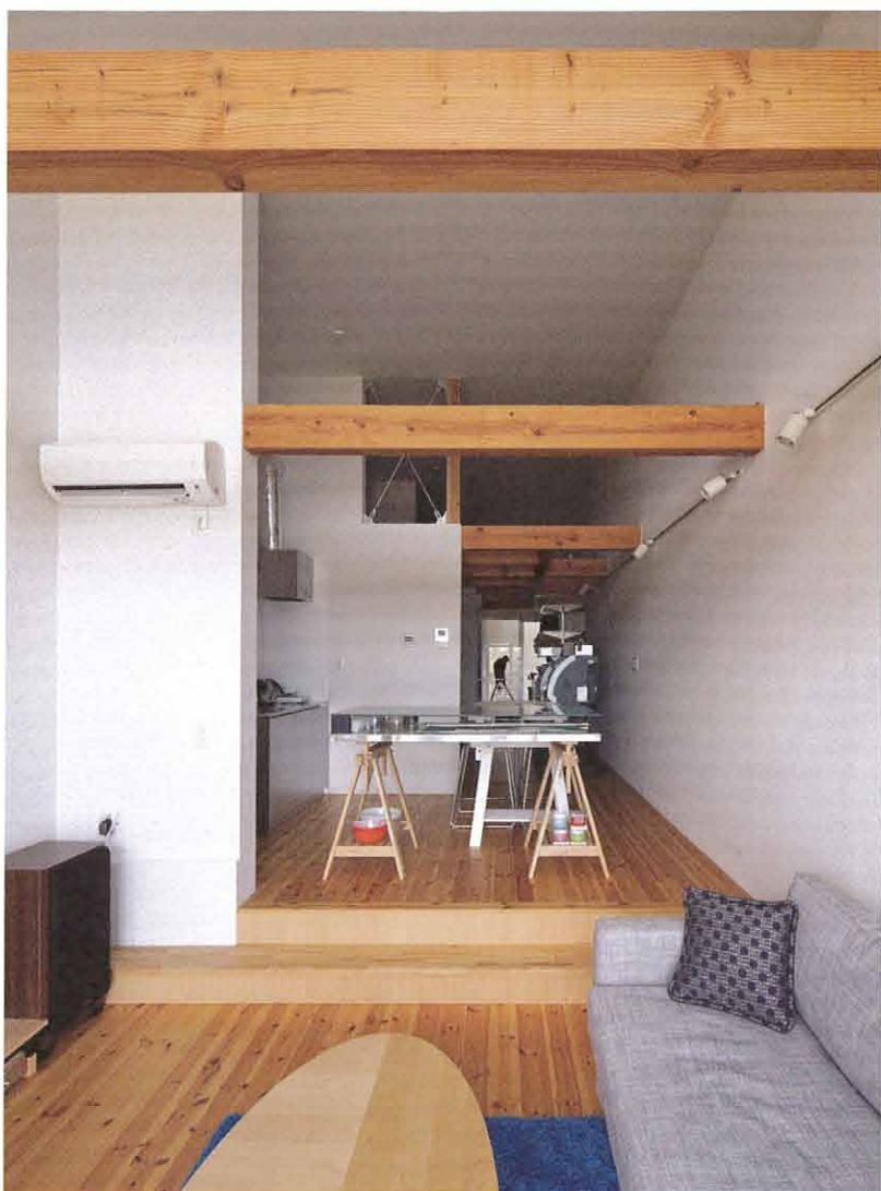
サーフィンに便利ようシャワールームは玄関近くに。小さなキッチンもあり、週末暮らしには十分な設備が整う。