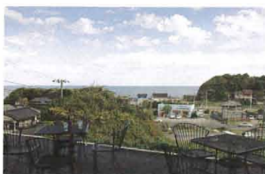
カフェからの眺望。住居の窓からも同様だが、目の前は海まで遠るものなし。朝日スポットとしても人気を呼びそう。